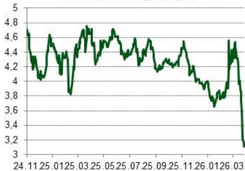
HU-DE 10Y spread, %